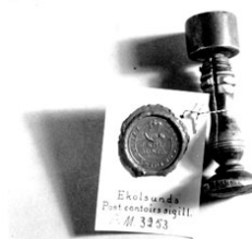
Sigill, runt med träskäft. Krönt posthorn och därunder "Ekolsunds" Runt kanterna "postcontoris sigill". Kom till Postmuseum 1916.