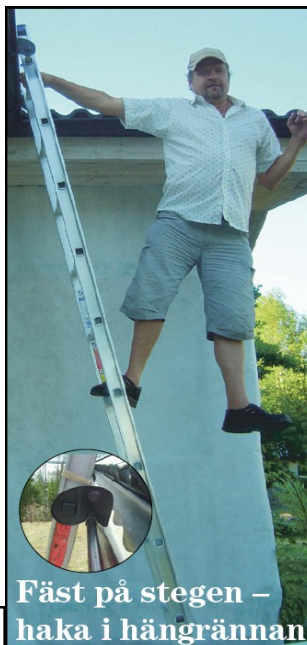
Fäst på stegen – haka i hängrännan